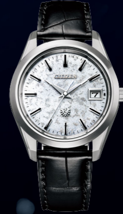
The CITIZEN 25周年記念限定モデル 第二弾 2020年10月発売 AQ4070-05A ¥385,000 税込 (税抜価格 ¥350,000) 限定 350本 / シリアルナンバー入り 高精度 年差 ±5秒 / 光発電エコ・ドライブ / 和紙文字板

年差 ±5秒 厳選された水晶振動子のみを使用。シチズンのマニユファクチュールが、年差 ±5秒の高精度を実現します。