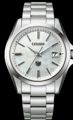
AQ4060-50W エコ・ドライブ ステンレス (デュラテクトブラチナ) 白蝶貝文字板 ¥330,000 税込 (税抜価格 ¥300,000) 限定 300 本