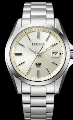
AQ4060-50A エコ・ドライブ ステンレス (デュラテクトブラチナ) ¥308,000 税込 (税抜価格 ¥280,000)