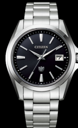
AQ4060-50E エコ・ドライブ ステンレス (デュラテクトブラチナ) ¥308,000 税込 (税抜価格 ¥280,000)